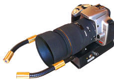
Profesionální fotografický systém